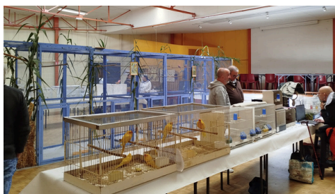
Bourse aux oiseaux