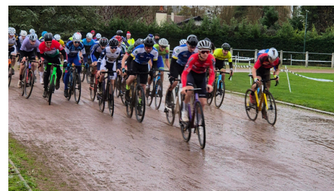
Cyclo cross - 150 participants