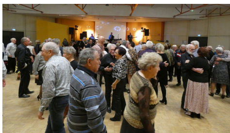
Thé dansant des Blés d'or